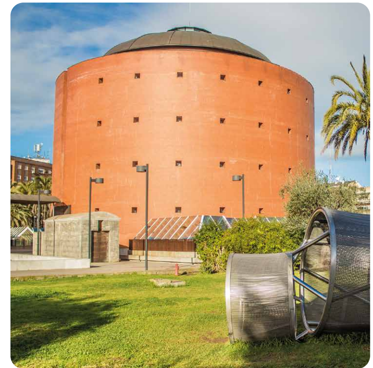
Museu da Extremadura e Ibero-Americano de Arte Contemporânea