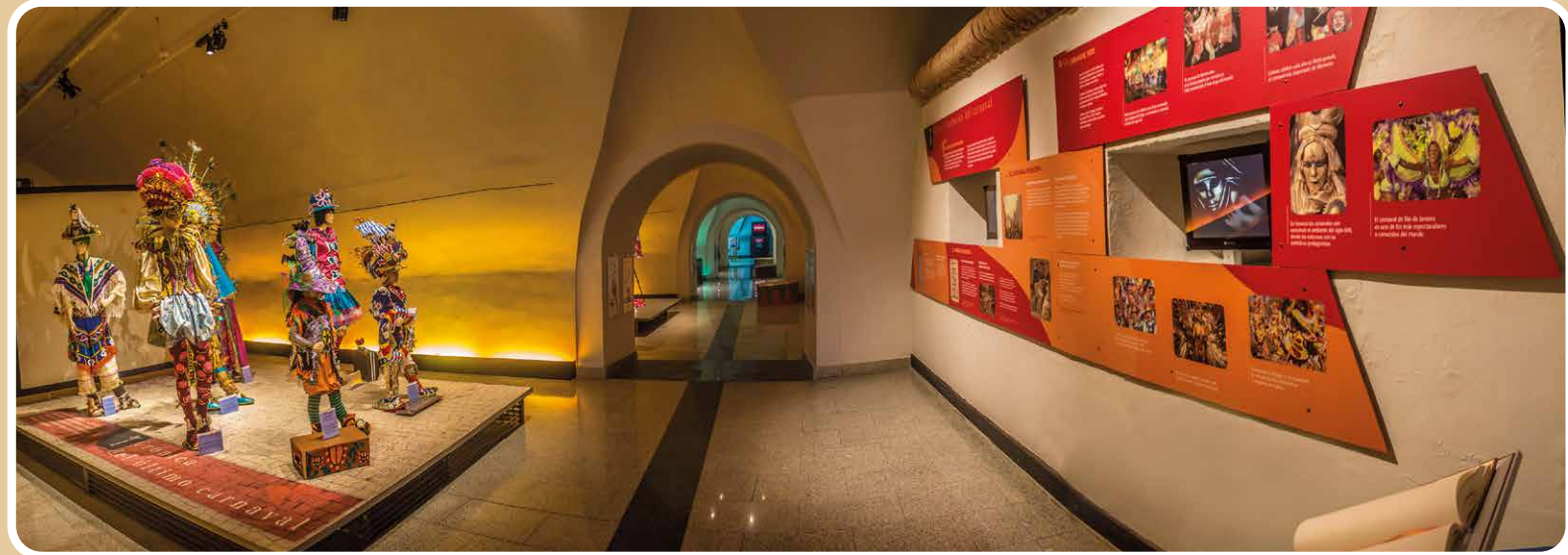
Museu do Carnaval

Os museus locais, onde cabem e, às vezes, se misturam a Antropologia, a História e a Arte, nascem entre os séculos XIX e XX com a missão de salvaguardar o seu património. Mas também serviram de suporte para a sua identidade.